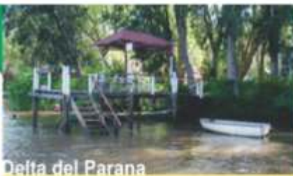
Delta del Parana

TRANSPORTE FLUVIAL DE PASAJEROS Desde 1935