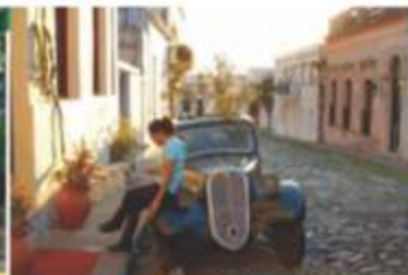
Colonia - Uruguay